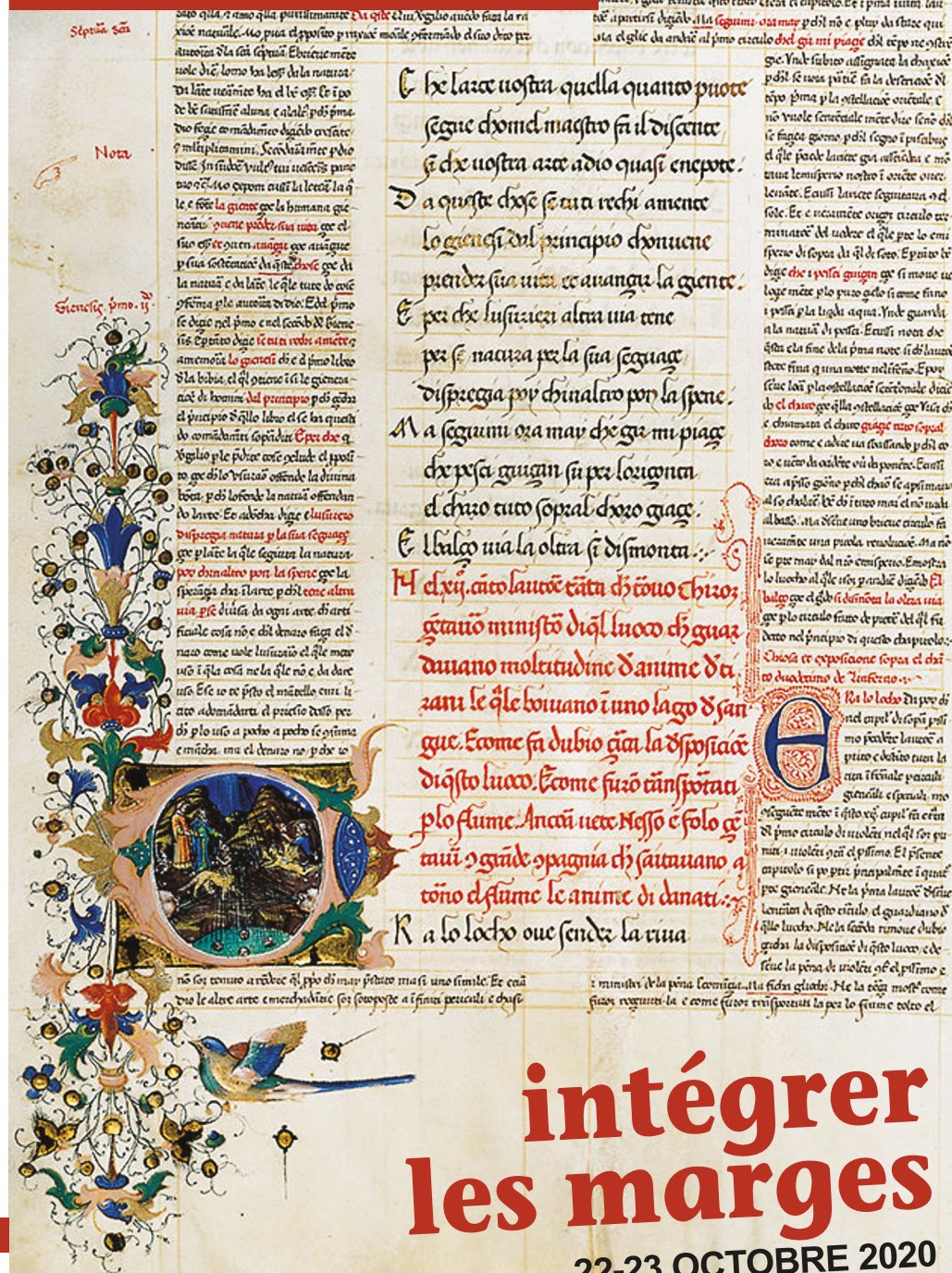
Création : Serge Pinche, CIHAM • Visuel : La Divine Comédie de Dante (BnF, Manuscrits, italien 78, f. 53v, 54r)