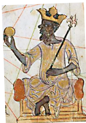
Création : Serge PINOCHE, CIHAM | Visuel : Atlas catalan (détail) [BnF, Ms. Espagnol 30, tab. VII]

Cyrille AILLET (Lyon 2) Marie-Pascale HALARY (Lyon 2) Xavier HÉLARY (Lyon 3) Francesco MONTORSI (Lyon 2)