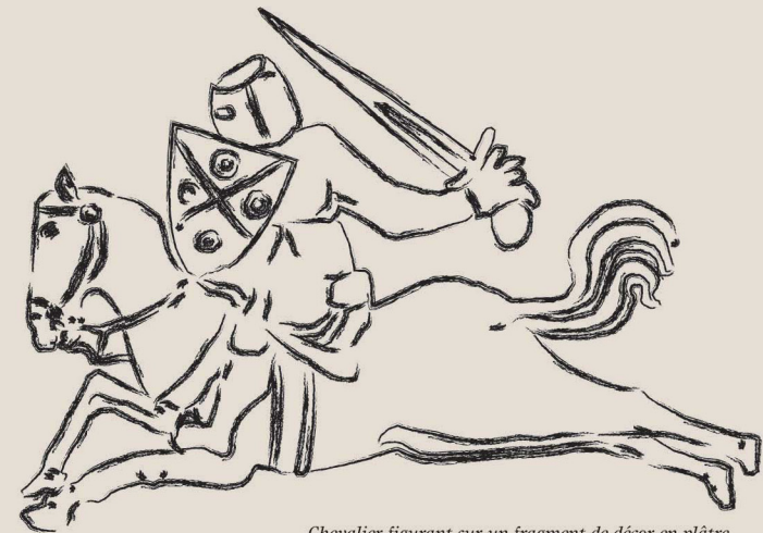
Chevalier figurant sur un fragment de décor en plâtre (XIIIe-XIVe siècle) conservé au musée de Cavaillon.