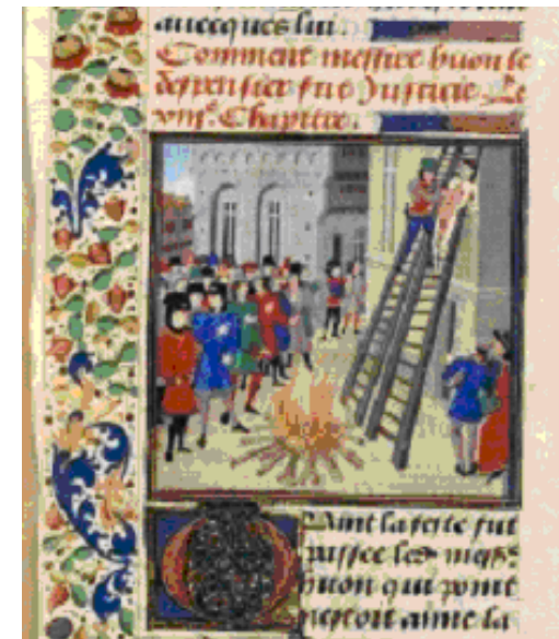
François 2643, fol. 11, Supplice de Hugues Despenser