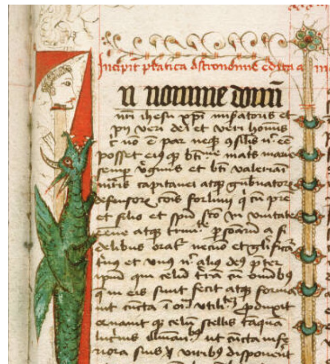
Avignon, Médiathèque Ceccano, ms 1022, f. 33r (fin XIII e siècle)