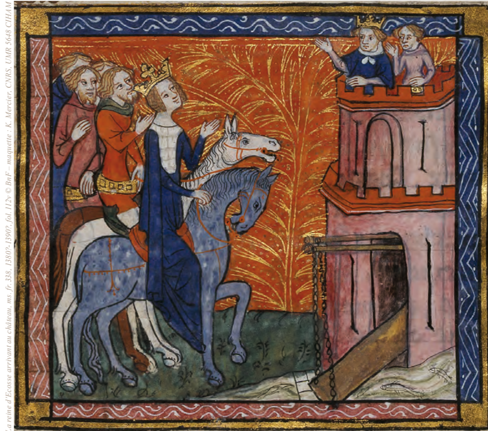
La reine d'Icosse arrivant au château, ms. fr. 338, f. 13802-13902, fol. 112v

iham Histoire Archéologie Littératures des mondes chrétiens et musulmans médiévaux UMR 5648