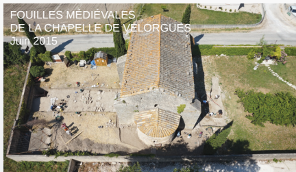
FOUILLES MÉDIÉVALES DE LA CHAPELLE DE VELOGUES Juin 2015

SAMEDI ET DIMANCHE : Chapelle de Velorgues 11h et 15h : Visite guidée De 10h à 18h : Visite libre Entrée libre