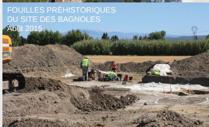
FOUILLES PRÉHISTORIQUES DU SITE DES BAGNOLES Août 2015

SAMEDI : 10H /// DIMANCHE : 15H30 Présentation des travaux en cours